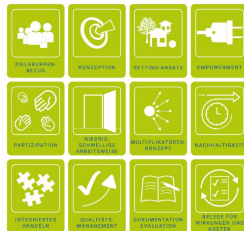
Grafik: Kooperationsverbund Gesundheitliche Chancengleichheit