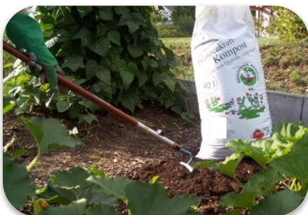
Anwendung / Zurück in die Natur