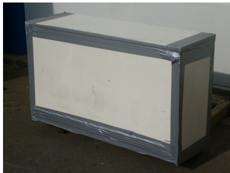
Korrekt verpacktes Nachtspeicherheizgerät

Im Zweifelsfall sollten Nachtspeicherheizgeräte immer als schadstoffhaltig betrachtet werden.